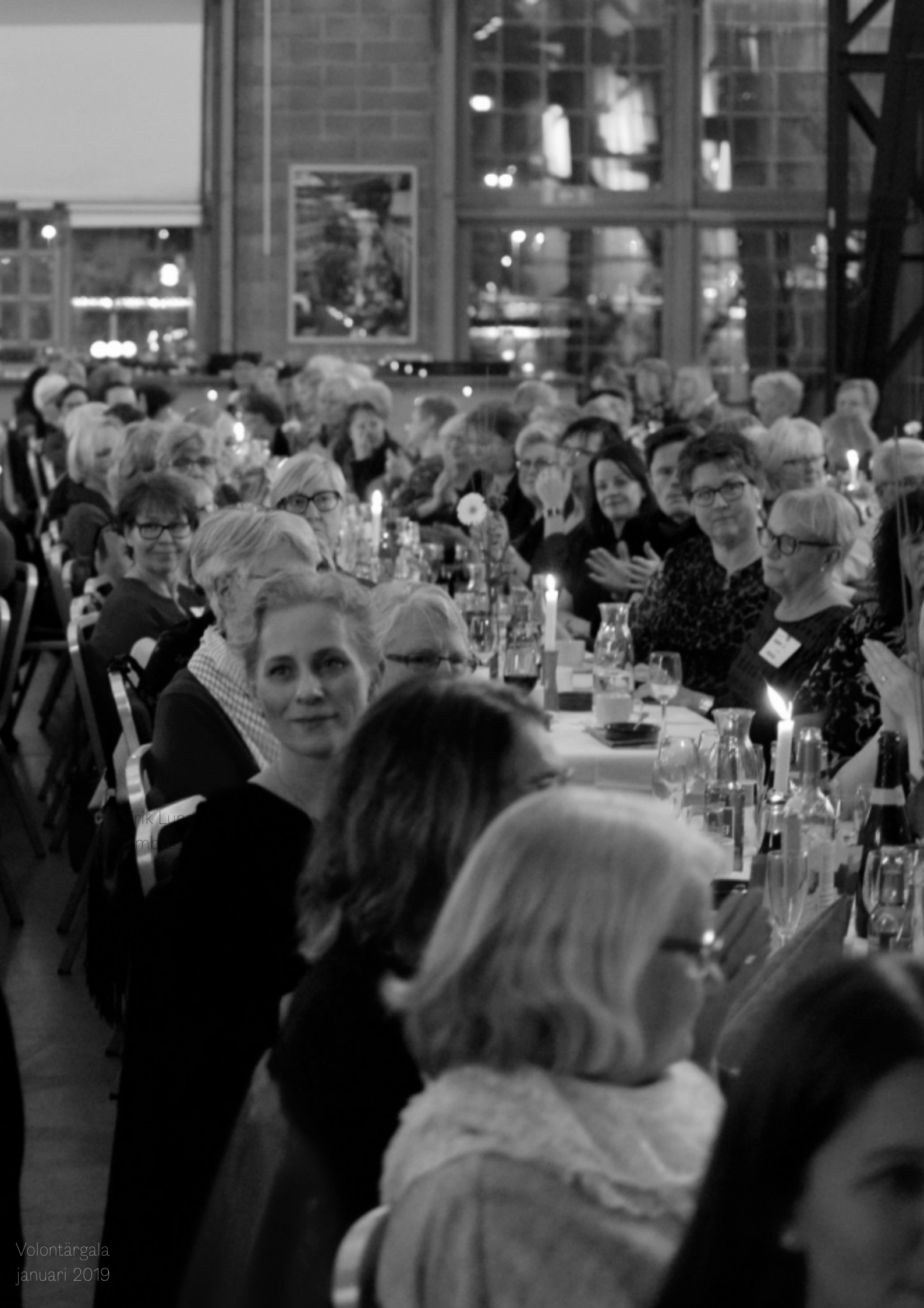
Volontärgala januari 2019